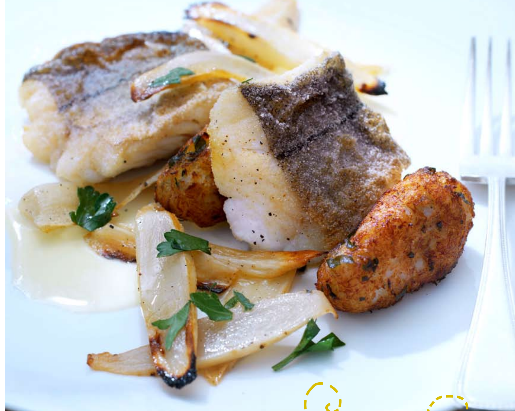
Op de huid gebakken schelvis met viskroketjes en schorseneren

‘zo wordt schelvis sterren-eten: neem dagverse vis en kies twee bereidingswijzen in één recept’