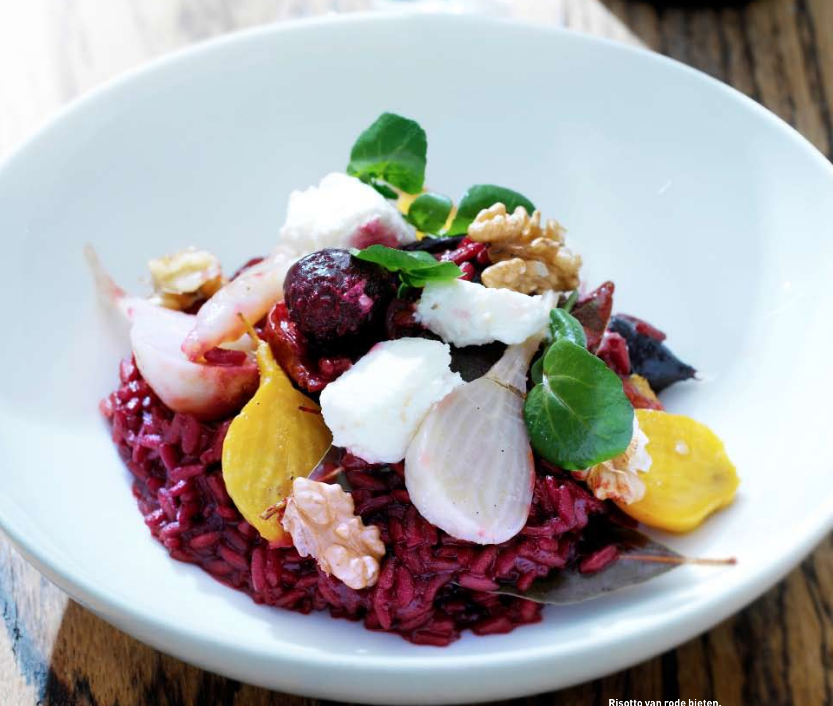
Risotto van rode bieten, ricotta en walnoot

‘spectaculair op je bord, aards van smaak én 100% vega: risotto met bieten en walnoten’