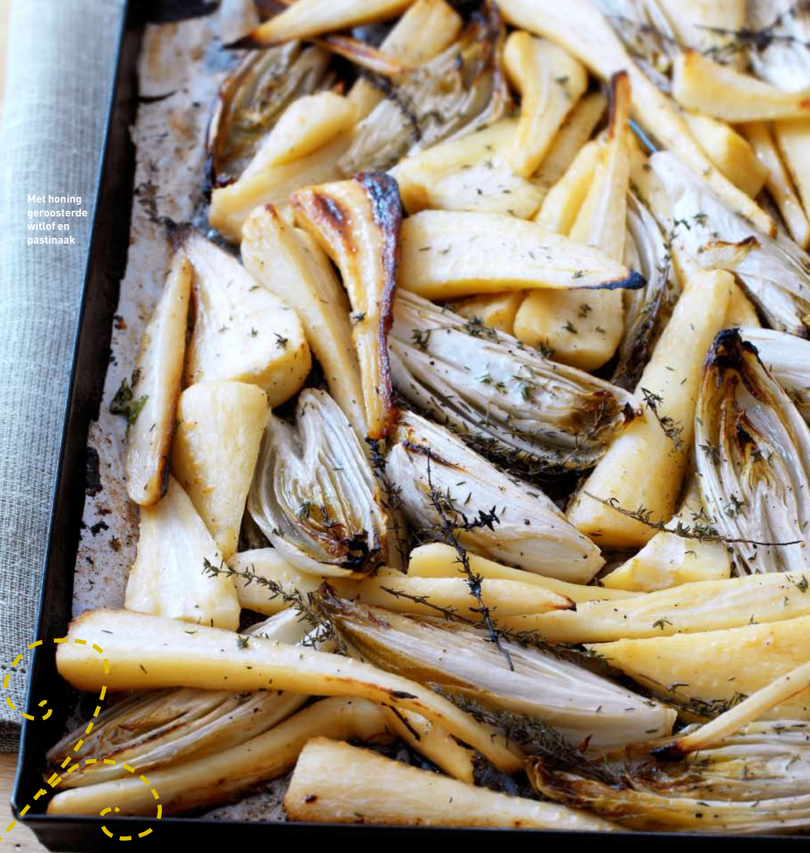
Met honing geroosterde witlof en pastinaak

‘geroosterde wintergroenten smaken fantastisch bij licht wild of stooftvlees’