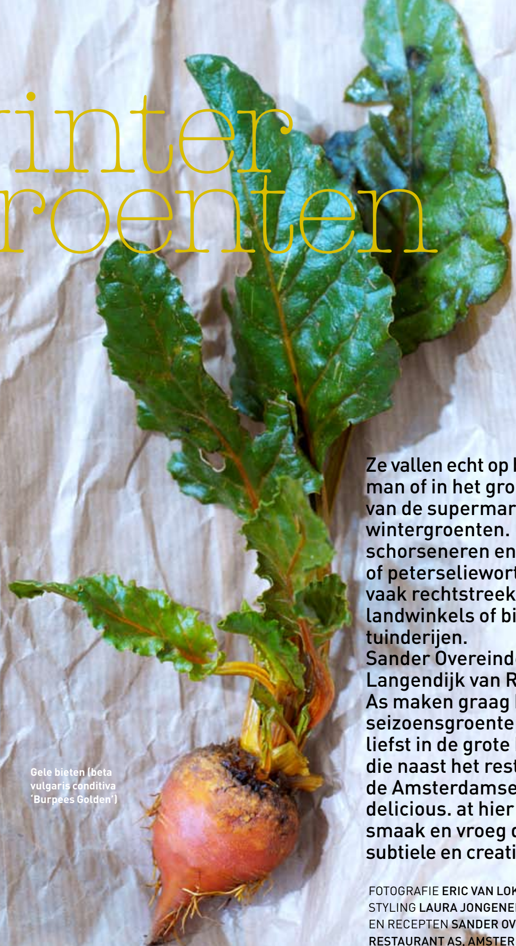
Gele bieten (beta vulgaris conditiva 'Burpees Golden')