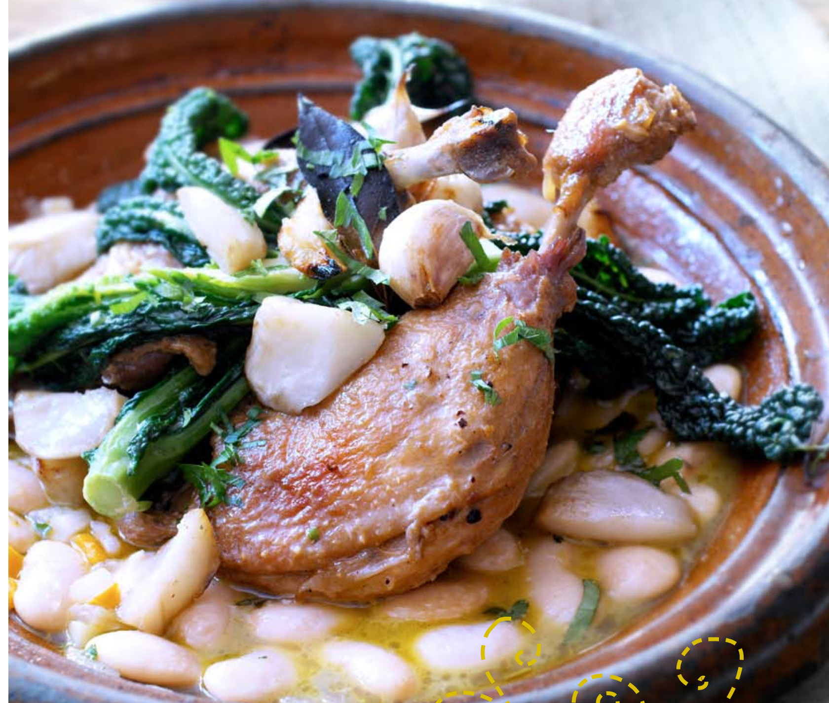
Eendenbout in kloosterbier, met mosterd en eekhoorntjesbrood

‘Sanders variant op Belgische ganzenbout: eend met mosterd, bier en eekhoorntjesbrood’